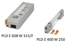
PLD E 608 W 315/F